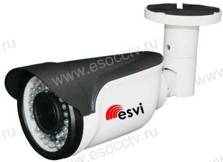
Руководство по быстрой настройке

Благодарим Вас за выбор нашего оборудования. Пожалуйста, перед использованием оборудования внимательно прочитайте данное руководство. Все программное обеспечение, необходимое для работы с оборудованием, Вы можете скачать с сайта esocctv.ru .