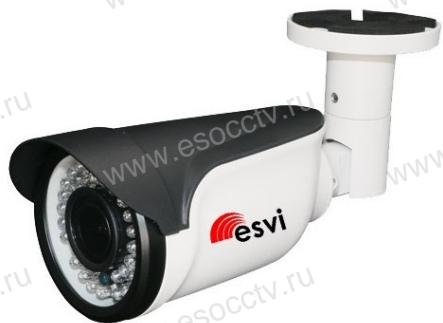
Руководство по быстрой настройке

Благодарим Вас за выбор нашего оборудования. Пожалуйста, перед использованием оборудования внимательно прочитайте данное руководство. Все программное обеспечение, необходимое для работы с оборудованием, Вы можете скачать с сайта esocctv.ru .