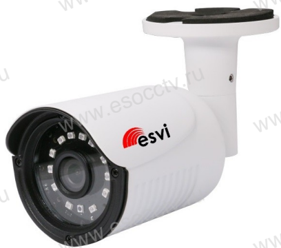
Руководство по быстрой настройке

Благодарим Вас за выбор нашего оборудования. Пожалуйста, перед использованием оборудования внимательно прочитайте данное руководство. Все программное обеспечение, необходимое для работы с оборудованием, Вы можете скачать с сайта esocctv.ru .